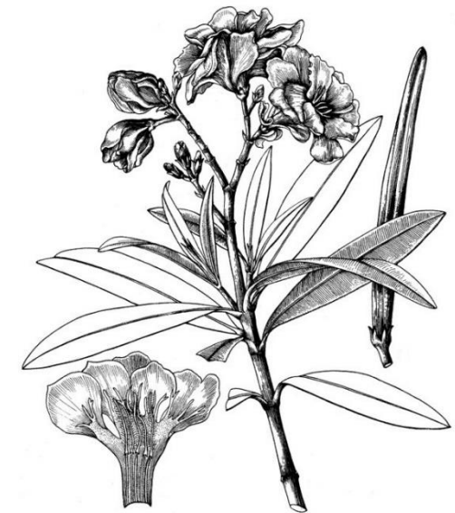
Európai leander ( Nerum oleander )

Térképes útmutatónk abban segít, hogy az aktuálisan virágzó fajok, vagy más időszakú látnivalók közül néhányat könnyedén megtaláljon Kertünkben.